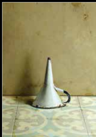
ערן רשף, משפך, 2011, שמן על עץ, 41X35 ס"מ, חתום.