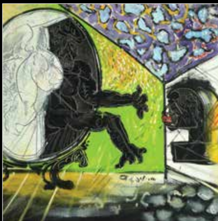
אורי ליפשיץ, ממול המראה, שמן על בד, 100X100 ס"מ, חתום.