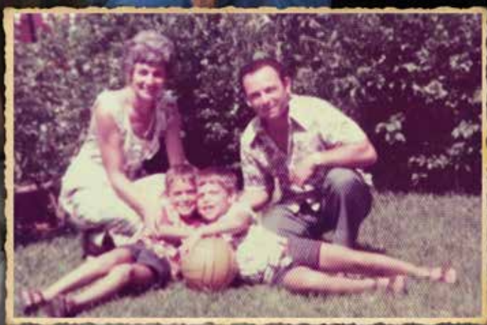
חצר בית משפחת זנפט, 1977, שבועות ספורים לאחר האימוץ