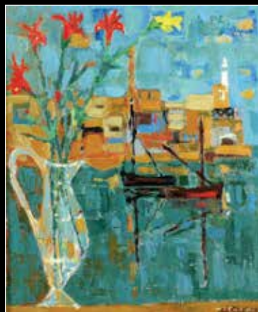
מיכאל ארגוב, סירות ואגרנטל פרחים, 1956, שמן על בד, 65X54 ס"מ, חתום.