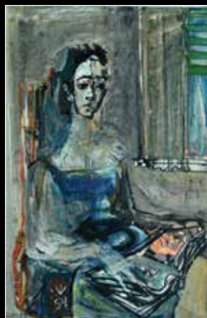
יחזקאל שטרייכמן, צילה, 1954, שמן על בד, 73X50 ס"מ, חתום.