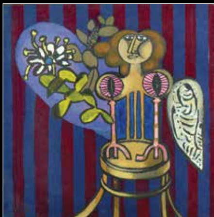
נפתלי בוז, נערה עם נרות שבת, 65X65 ס"מ, חתום.