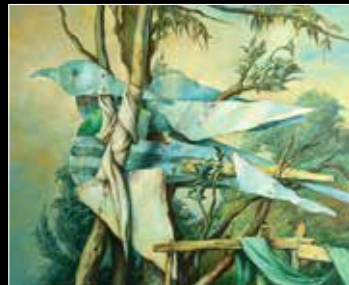
שמול בק, Permanent Flight, שמן על בד, 54X65 ס"מ, חתום.