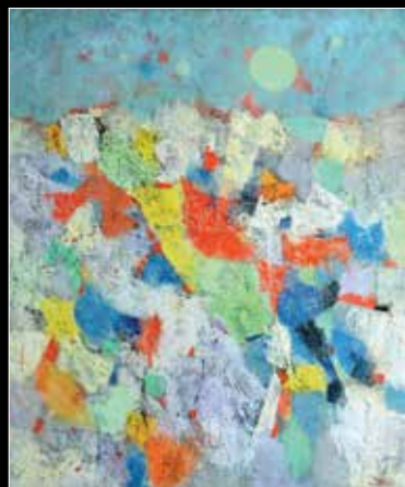
מרדכי ארדון, Paysage, 1976, שמן על בד, 61X50 ס"מ, חתום.