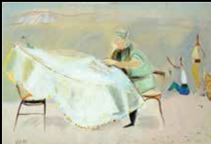
נחום גוטמן, דיגים, גואש ואקוורל על נייר, 38X55 ס"מ, חתום.