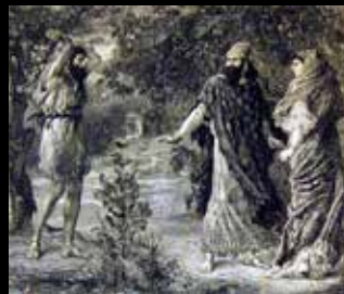
אליהו הנביא, אחאב ואיזבל בכרם נבות, מתוך הספר The Bible and its Story Book, 1909