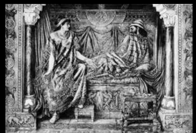
אחאב ואיזבל, מתוך הספר The Bible and its Story Book, 1909