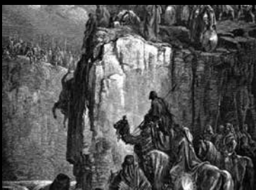
גוסטב דורה: אליהו הנביא שוחט את נביאי הבעל

מתוך אתר האינטרנט "דעת - לימודי יהדות ורוח" www.daat.ac.il