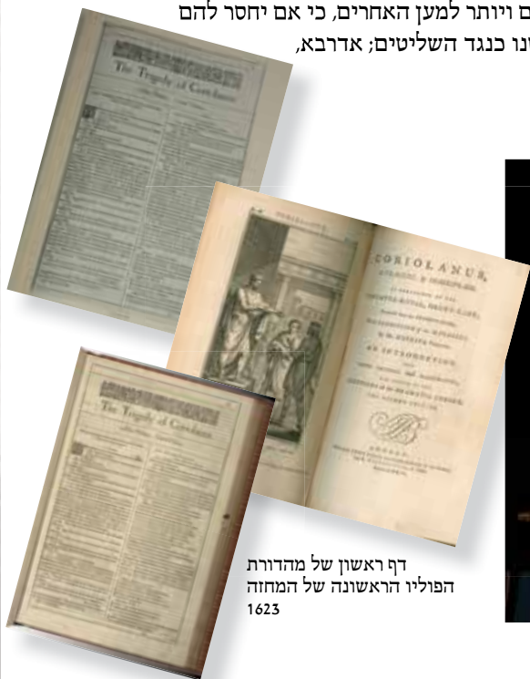
דף ראשון של מהדורת הפוליו הראשונה של המחזה 1623