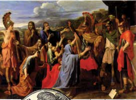
אמו של קרוילנוס, אשתו ובנו מתחננים שלא יתקוף את רומא. ניקולא פוסן 1652-1653.

הבטן הרצינית שלנו, היא היתה שקולה, ולא נמהרת כמו מאשימיה, וכך ענתה: "נכון, חברי איגוד הגוף", אמרה היא, "שאני הראשונה שמקבלת את מַכְסַת האוכל אשר עליו אתם חיים; וכך יאה, שכן אני היא המַחְסֵן והחנות של כל הגוף. אבל, אם תִּכְרוּ, אני שולחת את הכל בְּנֵהרות דמכם,