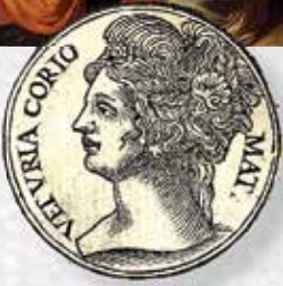
איור של וולמניה

עד לארמון, הלב, עד כס המוח; ודרך פרודורים ומסדרונות של האדם ממני מקבלים כל עורק עז, כל נים נחות את מנת הטֵבֵע שממנה הם חיים. וגם אם, ידידים טובים, כולכם ביחד - את זה אומרת, אל תשכח, הבטן - כן, אדוני; טוב, טוב.