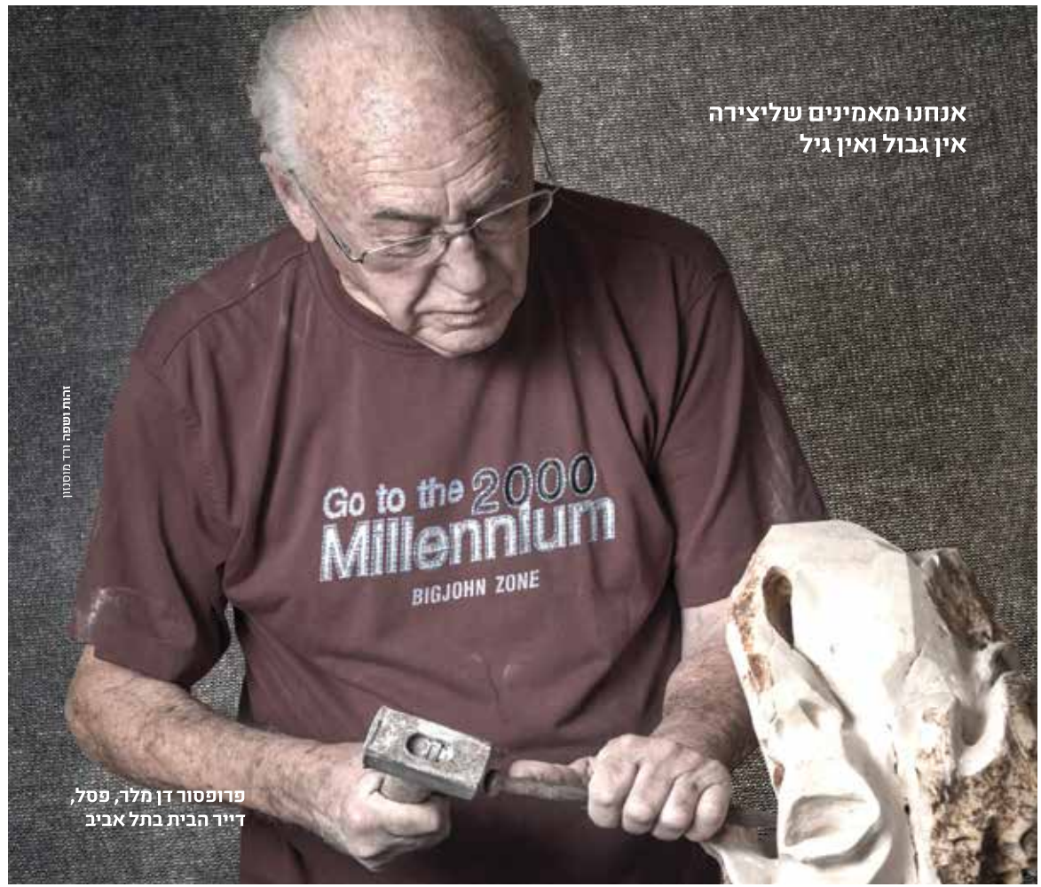
אנחנו מאמינים שליצירה אין גבול ואין גיל