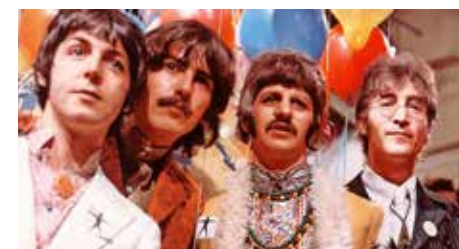
הביטלס בשידור הלוויין, 1967

שירם של הביטלס, שיצא כסינגל ב-1967. נכתב על ידי ג'ון לנון ומיוחס בקרדיט ללנון-מקרטיני. הביטלס הופיעו עם השיר כנציגי בריטניה ב"העולם שלנו", שידור הלוויין החי הטלוויזיוני הגלובלי הראשון. צפו בו למעלה מ-400 מיליון איש ב-25 ארצות ב-25/6/1967. שנים לאחר מכן, ב-2004 ליתר דיוק, דירג מגזין ה"רולינג סטונס" את השיר במקום ה-370 המכובד ברשימת 500 השירים הטובים ביותר של כל הזמנים. למקום הראשון, אגב, הגיע השיר "כמו אבן מתגלגלת" של בוב דילן. הביטלס התבקשו להציע שיר עם מסר אוניברסלי ומובן לכל. "זה היה שיר עם השראה והם באמת רצו להעביר לעולם מסר", אמר בראיין אפשטיין, מנהל הלהקה. "מה שנחמד בו זה שאי אפשר לפרש אותו אחרת. זה מסר ברור שאומר שהאהבה היא הכל". לפי העיתונאי ג'ייד רייט, "לנון הוקסם מכוחן של סיסמאות לאחד אנשים, ולא חשש לייצר אמנות מתוך תעמולה". חברי הלהקה התחילו להקליט ב-14 ביוני 1967, הקליטו 33 טייקים ובחרו בטייק ה-10 כטוב ביותר. במהלך הימים הבאים הם הקליטו את הערוצים השונים, כולל קולות, פסנתר (שניגן ג'ורג' מרטין, המפיק המוזיקלי שלהם), בנג'ו (שבו ניגן ג'ון לנון), גיטרה ותפקידי התזמורת. לימים, פול מקרטיני וג'ורג' הריסון בכלל לא היו בטוחים שהשיר נכתב במיוחד לשידור הלוויין של "העולם שלנו". בניגוד למה שנטען לפני כן, מקרטיני אמר שהשיר כבר היה קיים ופשוט נשלף לצורך התוכנית.