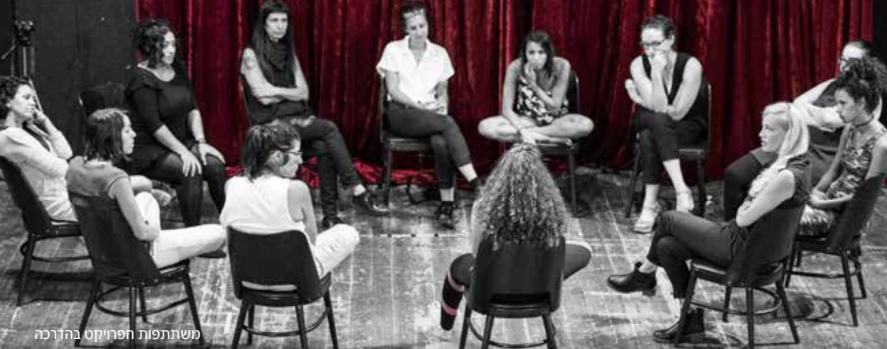
משתתפות הפרויקט בהדרכה

"שחרי אותו את ההרס הכמוס בך. זה שהמתיק לך סודות בלילות הקרים. שחרי אותו כי כבר אין בך רצון שימשיך לקנן בך, שימשיך לעמוד על המשמר במפתן ביתך. שחרי אותו כי יש בך רצון לימים אחרים" (מאת יובל גולדנברג, משתתפת בפרויקט "פלטפורמא")