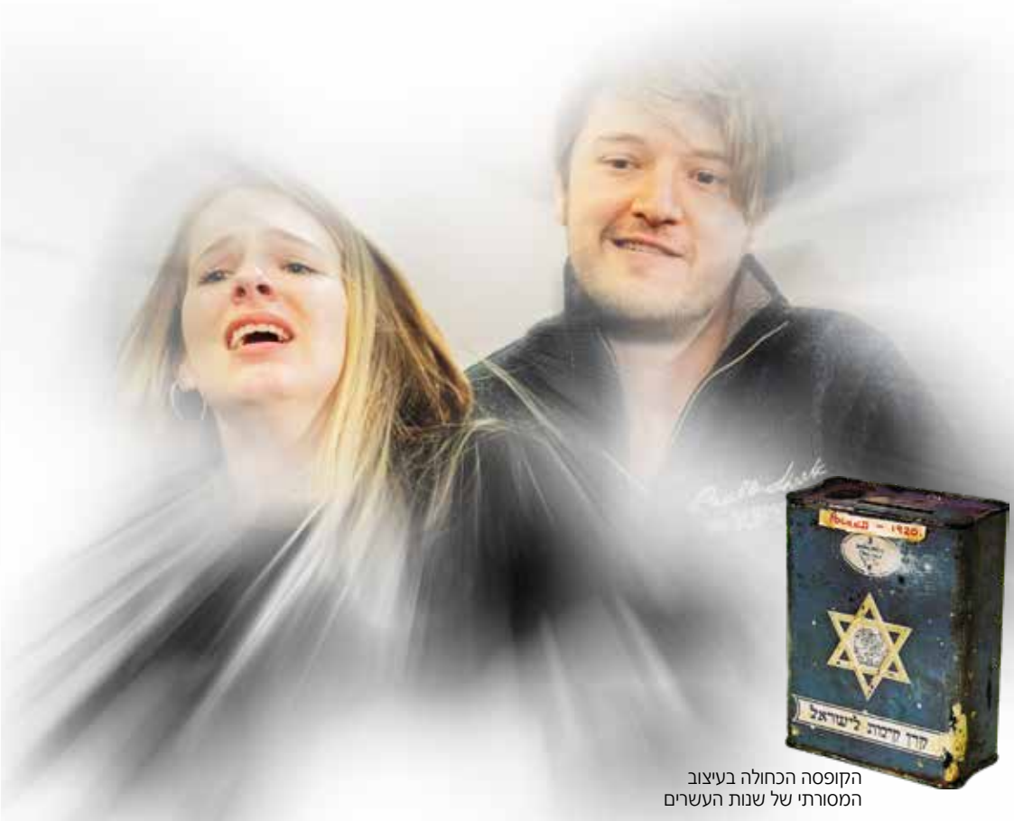
הקופסה הכחולה בעיצוב המסורתי של שנות העשרים