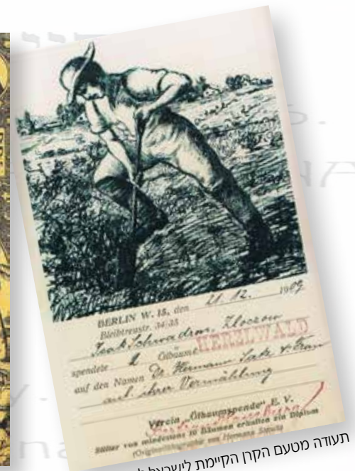
תעודה מטעם הקרן הקיימת לישראל לנטיעת עצי זית