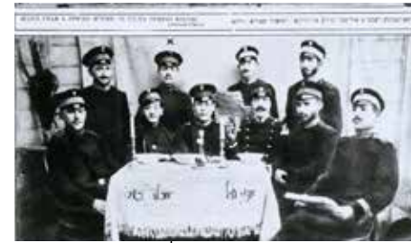
חיילים יהודים בצבא הצאר

כינוי למוסד שהתקיים ברוסיה הצארית, שכלל גיוס כפוי של ילדים יתומים ועניים, בני הקהילות היהודיות ברוסיה לצבא הצאר. כחלק ממדיניות שמטרתה השפעה על אוכלוסיית היהודים באמצעות 'חינוך מחדש' של הדור הצעיר והמרת דתם של המגויסים בכפיה, מונו חטפנים ("כאפערס") שתפקידם היה לחטוף את הילדים ולהסגירם לצבא. הילדים שחונכו במסגרת צבאית זו, שכללה עינויים רבים, גויסו בבגרותם לכווחות המזוינים של צבא הצאר וכונו