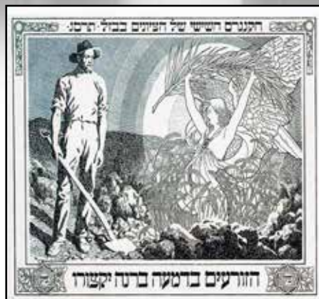
עיטור לכרטיס הציור השישי שהתכנס בבאזל ב-1903. דמותו של מלאך המבשר גאולה לנוכח עיניו של איכר חסון המייצג את חלוצי ההתיישבות בארץ ישראל

מילות השיר "פה בארץ חמדת אבות" מתוך הספר "צלילי חנינא" בהוצאת "גימנסיה הרצליה" 1926