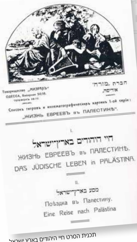
תכנית הסרט חיי היהודים בארץ ישראל

(תמונות ה"מזרח"). שעות אחדות של עונג רוחני היו לנו אתמול בתיאטרון "קולטורה", ששם הציגו מורשי החברה "מזרח" מאוסדה את התמונות הקינמטוגרפיות מחיי היהודים בארץ-ישראל, לפני קבוצה של סופרים ובעלי הקינו-תיאטרונים בפה. לפני עינינו עברו התמונות המקסימות של הישוב החדש וגם המראות הנלבבים של הישוב הישן והמקומות ההיסטוריים העתיקים. כמעט לא היה מחזה אחד מהחיים הארץ-ישראליים במשך השנים האחרונות, שלא נקבע על התמונה [...]