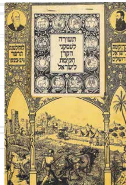
לוח שנה של הקרן הקיימת לשנת תרפ"ד. הצייר – זאב רבן, ירושלים 1923

מתוך הכתבה: "סרט התעמולה הראשון בעולם, חוגג יום הולדת 100" מאת עפר אדרת. עיתון "הארץ", 24.11.2013. © כל הזכויות שמורות להוצאת עיתון "הארץ" בע"מ