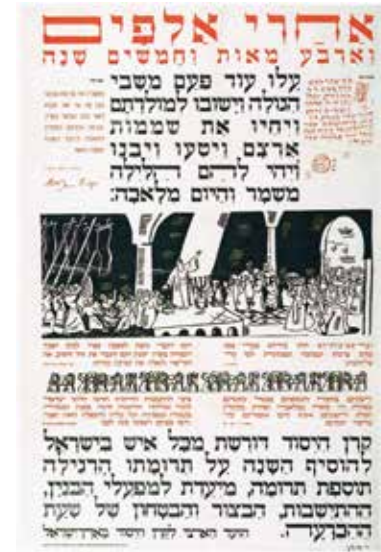
כרזה של קרן הייסוד המשווה את המפעל הציוני לשיבת ציון הראשונה - בימי עזרא ונחמיה