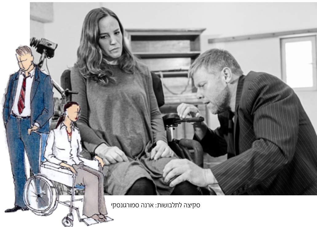
סקיצה לתלבושות: ארנה סמורגונסקי

מתוך: "מתים לראות": מלחמה, זיכרון וטלוויזיה בישראל 1967 - 1991 מאת דן ערב. הוצאת "רסלינג", 2017.