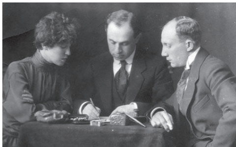
גוסין, צמח, רובינא