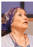
רומיה: כוכבה הררי