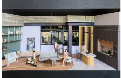
דגם התפאורה: אלכסנדרה נרדי