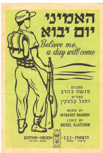
דף מילות השיר.