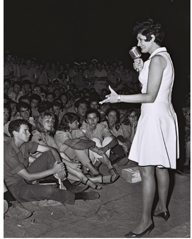
1967, צילום: דוד אלדך, לע"מ