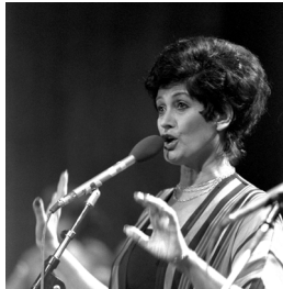
1979, צילום: יעקב סער, לע"מ

בתכניית ההצגה נעשה שימוש בשערי דפי שירים. אנו מכבדים את זכויותיהם של בעלי זכויות היוצרים והשקענו מאמצים באיתורם לצורך שימוש בהם. כל עוד לא אותרו בעלי הזכויות, השימוש יעשה על פי סעיף 27 לחוק זכויות יוצרים תשס"ח-2007. בעלי הזכויות מוזמנים לפנות באמצעות דואר אלקטרוני לכתובת archive@habima.org.il בבקשה למתן קרדיט או לחדול מעשיית השימוש ביצירה. תודה!