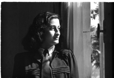
1945, צילום: אפרים ארדה