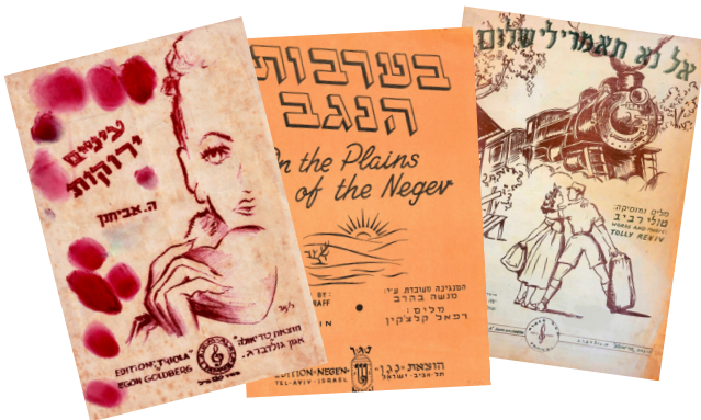
דפי מילות שירים בהוצאת "נגן" (יואל שרייבר) ו"טריאוולה" (אגון גולדברג)