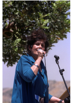
2000, צילום: אבי אוהיון, לע"מ